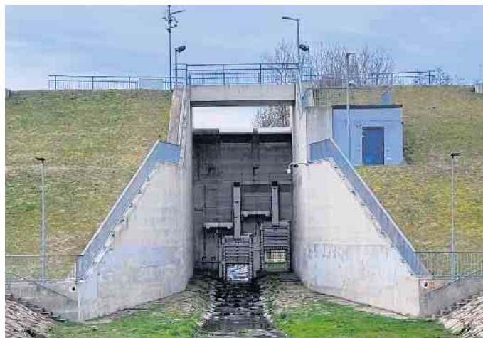
... und -auslass am Hochwasserrückhaltebecken Neuwürschnitz (Dammhöhe 12 bis 13 Meter).