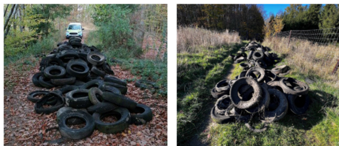
Altreifen Ablagerungen in einem Waldstück bei Rodert und auf einem Wirtschaftsweg zwischen Houverath und Scheuren

Die Stadt bittet um Mithilfe und Unterstützung aus der Bürgerschaft: Halten Sie die Augen offen und melden Sie Beobachtungen, notieren Sie sich ggfs. Autokennzeichen, damit eine Strafverfolgung eingeleitet und der/die Verursachende zur Rechenschaft gezogen werden kann.