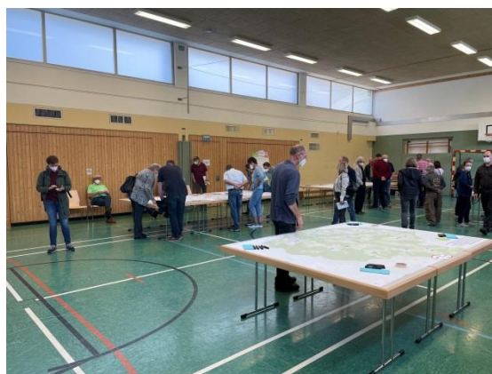
Abbildung 11: Viele Bewohner:innen sind zu dem Workshop in Mutscheid gekommen