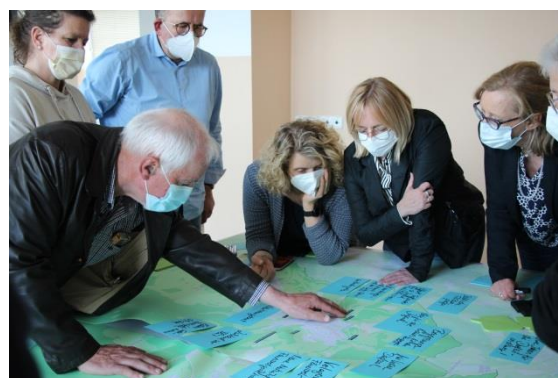
Abbildung 2: Teilnehmer:innen diskutieren über Maßnahmen in den Dörfern