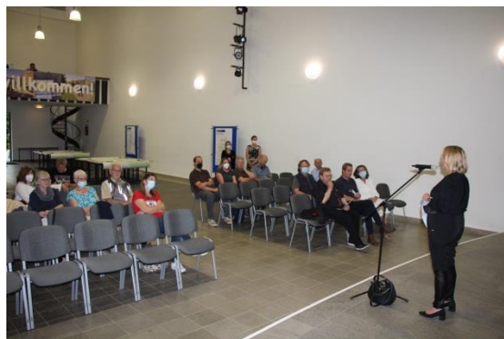
Abbildung 16: Die Bürgermeisterin begrüßt die Teilnehmer:innen zu dem Workshop in der Kernstadt