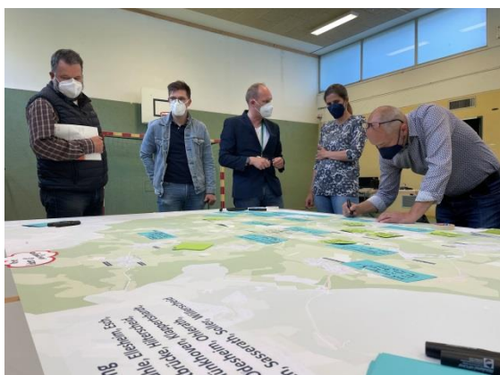
Abbildung 12: Teilnehmer:innen sprechen gemeinsam über die Entwicklung der Dörfer