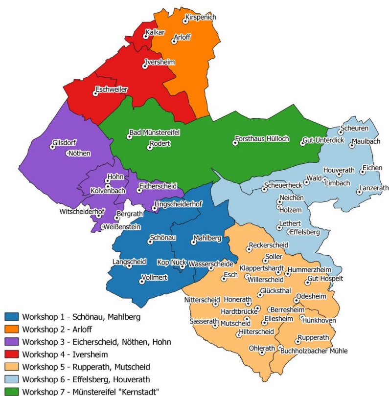
Abbildung 1: Einteilung des Stadtgebiets in sieben Workshops

Alle Anregungen und Ideen aus den Workshops wurden mit Hilfe von Moderationskarten festgehalten. Zudem sind in der vorliegenden Dokumentation auch Anregungen von Personen aufgeführt, die nicht an einem der Workshops teilnehmen konnten und ihre Ideen schriftlich eingereicht haben. In den folgenden Kapiteln finden sich alle Äußerungen aufgelistet und sortiert nach Ort und Themenbereich.