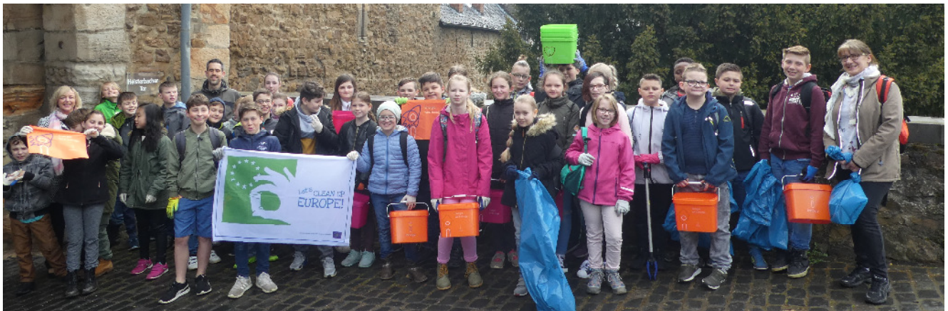
(Klassen 5a, 5c, 5d der Realschule mit Bürgermeisterin Sabine Preiser-Marian)

Im Rahmen der europaweiten Aktion „Let's Clean Up Europe“ rief auch Bürgermeisterin Sabine Preiser-Marian zum alljährlichen „Großreinmachen“ auf. Durch Bekanntmachung im Amtsblatt aber auch durch persönliche Einladungen wurden Vereine, Schulen, Kindergärten und alle, denen eine saubere Umwelt wichtig ist, aufgefordert, sich an der Aktion „Eine Stadt macht Frühjahrsputz“ zu beteiligen.