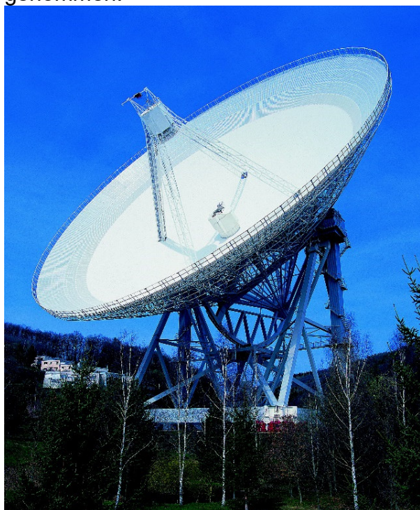
Das Radioteleskop Effelsberg. Foto aus dem Jahr 2005, aufgenommen anlässlich der Einweihung und Eröffnung des Radioteleskop-Wanderwegs

Ab dem 1. August 1972 hatte das Radioteleskop dann seinen vollen Messbetrieb aufgenommen. 15 Jahre zuvor, am 17. September 1956, hatte das erste Radioteleskop in Deutschland, der Astropeiler auf dem Stockert bei Eschweiler, seinen Betrieb aufgenommen.