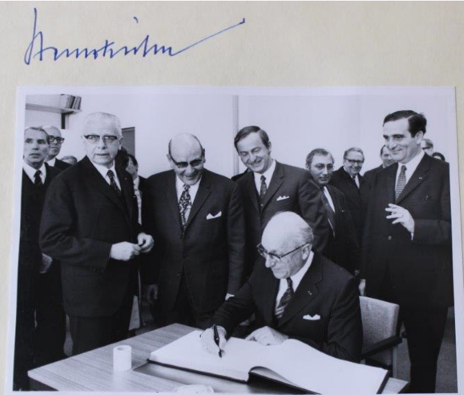
Heinz Kühn Ministerpräsident des Landes Nordrhein-Westfalen

anlässlich des Staatsbesuches am 28. 4. 1971 beim Radioteleskop Bad Münstereifel-Effelsberg