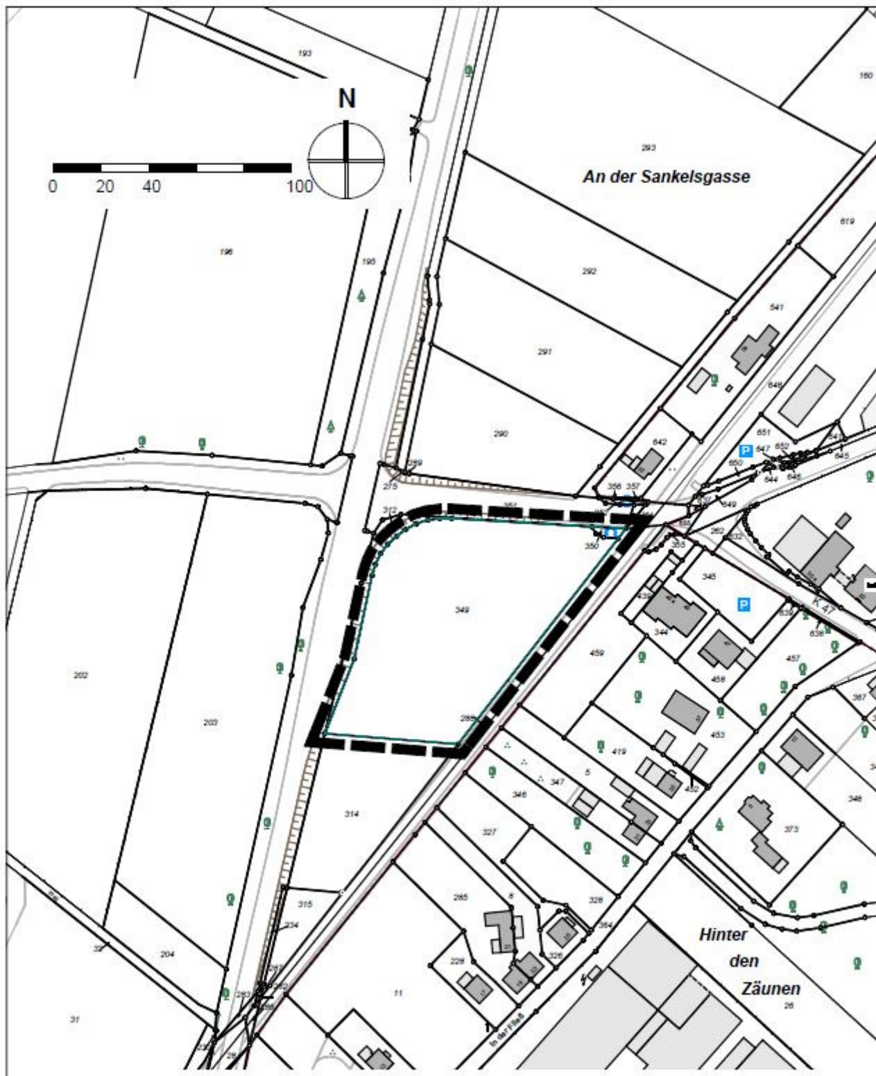
Stadt Bad Münstereifel 32. Änderung des Flächennutzungsplanes "Sondergebiet Zweckbestimmung: Einzelhandel/Nahversorgung" für den Bereich Bahnhofstraße / L 11 / L 194, Ortsteil Arloff - Übersicht zum räumlichen Geltungsbereich -