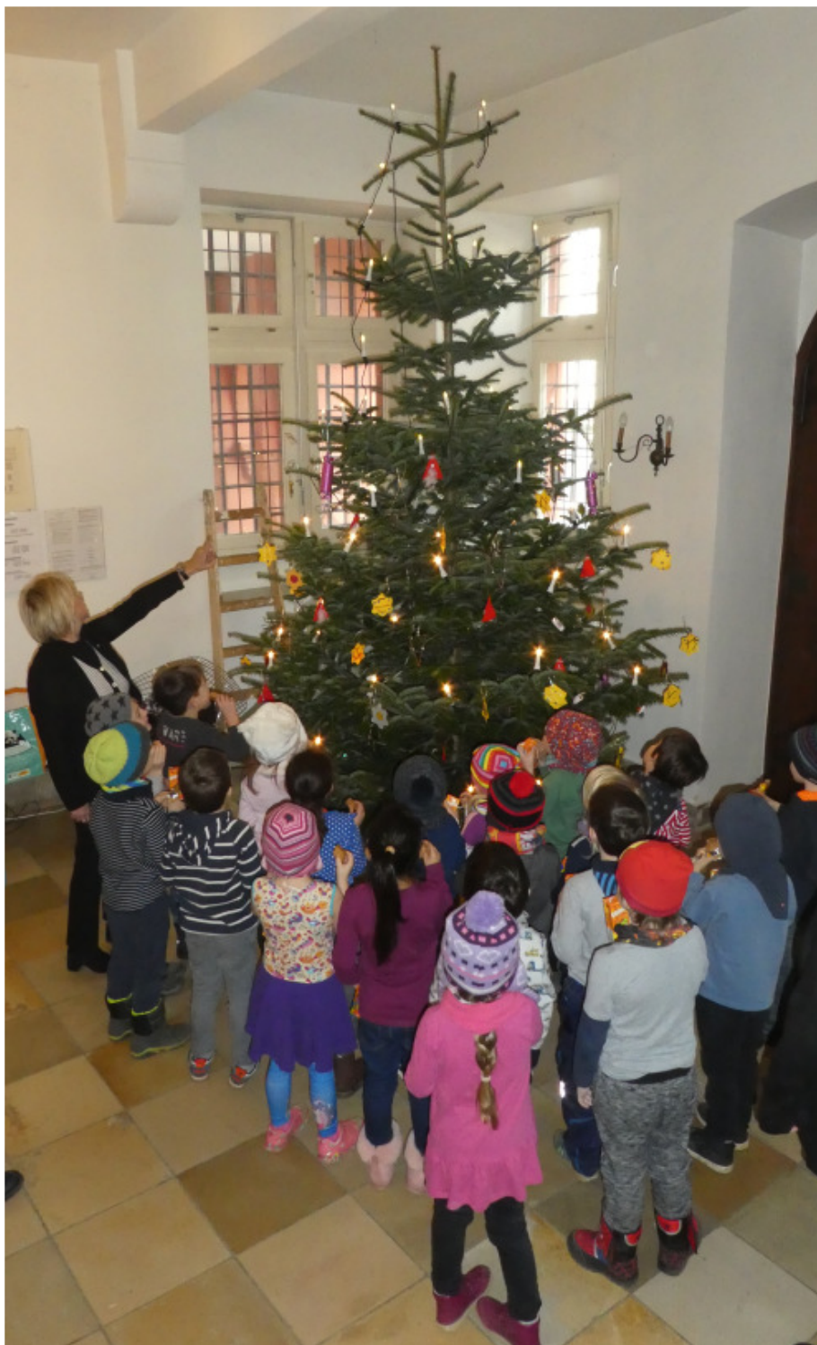
Kinder des DRK-Kindergartens Iversheim bei der Bürgermeisterin

Kurz vor Beginn der Adventszeit kamen auf Einladung der Bürgermeisterin 20 Kinder des DRK-Kindergartens Iversheim mit ihren Erzieherinnen zum Baumschmücken ins Rathaus. Sie hatten fleißig vorgesorgt, um den großen Tannenbaum im Foyer des Rathauses mit selbstgebastelten Sternen, Nikoläusen, Überraschungsbonbons und vielem mehr zu verschönern.